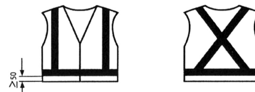
Cotas en mm